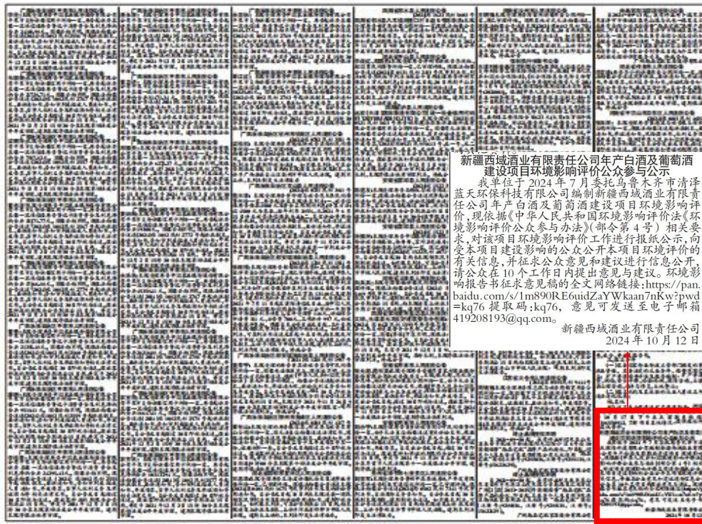
图3 本项目征求意见稿第一次报纸公示照片