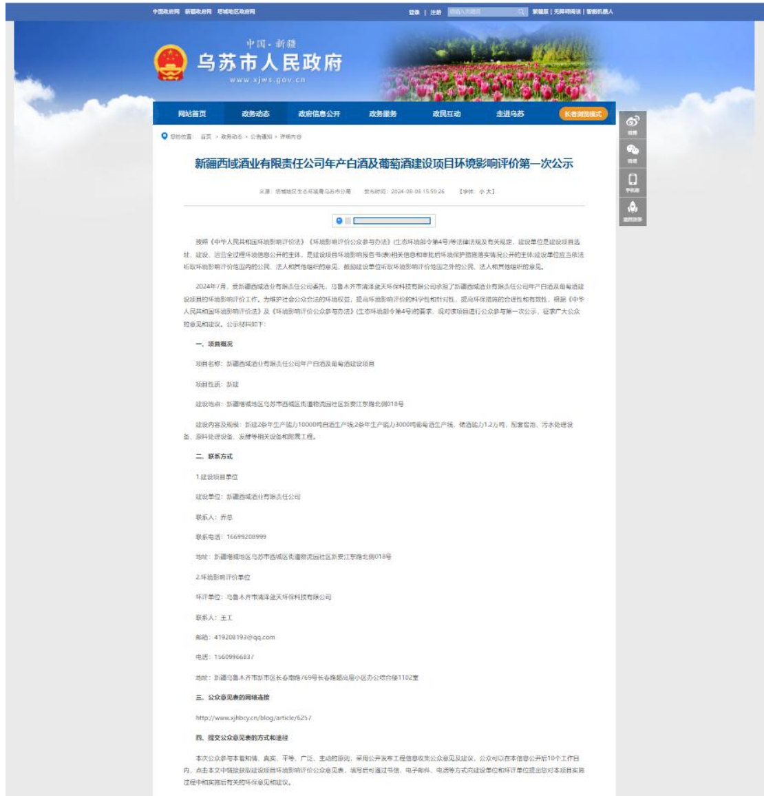
图 1 本项目第一次网络公示截图

( https://xjws.gov.cn/zwdt/ggtz/content_101906 ) 上进行了第一次网络公示，向公众告知本项目的建设情况，载体选择符合《环境影响评价公众参与办法》要求。网络公示截图见图 1。