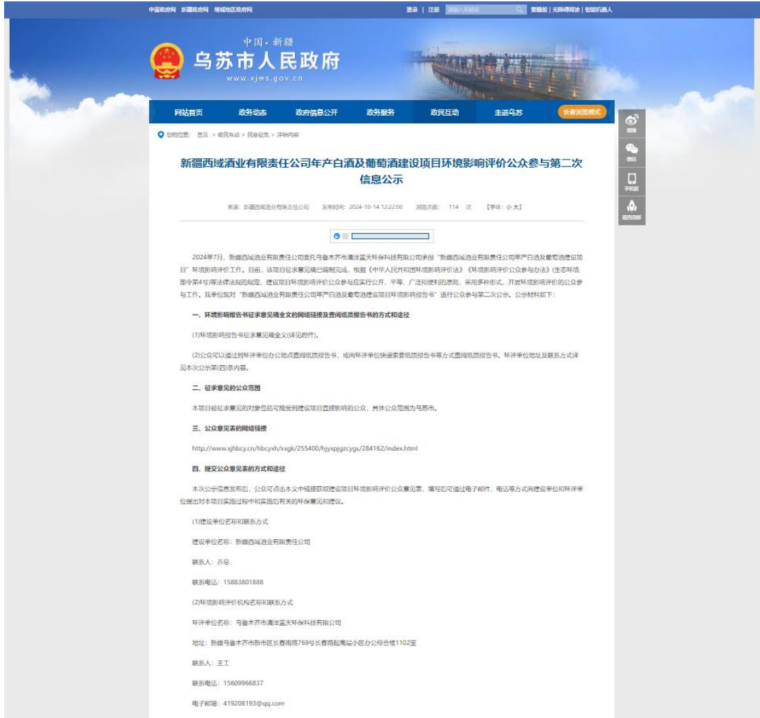
图 2 本项目征求意见稿网络公示截图